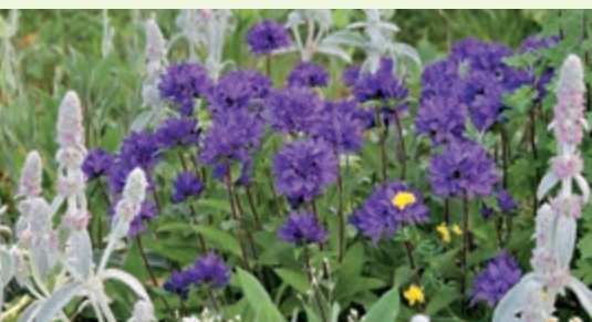
Die Knäuel-Glockenblume bringt Abwechslung in Ihr Staudenbeet. Hier in Verbindung mit dem Wollziest.

Ihren Namen verdanken Glockenblumen der Form ihrer hübschen Blüten. Diese sind meist lila oder blau in unterschiedlichen Intensitäten. Hierdurch lassen sie sich hervorragend etwa mit Rosen oder Storchschnäbel kombinieren. Die Gattung der Glockenblumen zeichnet sich durch eine bemerkenswerte Vielfalt aus. Die einzelnen Arten unterscheiden sich unter anderem in der Anordnung der Blüten, der Wuchshöhe und der Anforderungen an den Standort. Glockenblumen mit moderater Größe sind beispielsweise die Pfirsichblättrige oder die Knäuel-Glockenblume. Die Wald-Glockenblume wiederum hat den Charakter einer Großstaude. Zu den Zwergen gehört etwa die Kaparten-Glockenblume. Dadurch passen Glockenblumen in jeden Garten. Im Zeitraum von März bis Oktober können Glockenblumen gepflanzt werden. Der Boden sollte dabei gut durchlässig sein. Schweren Böden kann Sand beigemischt werden. In der Regel sollte der Standort sonnig bis halbschattig gewählt werden. Einzelne Arten bevorzugen es jedoch auch schattig. Daher sind die artenspezifischen Ansprüche bei der Wahl des Standorts zu berücksichtigen. Einmal gepflanzt, benötigen Glockenblumen nicht viel Pflege. Sie sind moderat zu gießen. Ein Rückschnitt erfolgt nach dem Winter. Ältere Exemplare können im Frühjahr oder Herbst durch Teilung verjüngt werden. ab