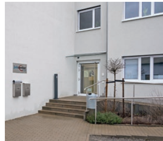
Eingang des Jobcenters im Bauscherweg in Miltenberg.