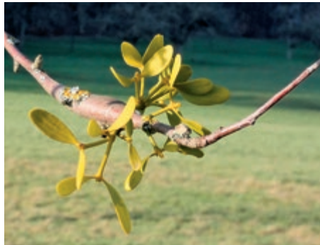
Auch an sehr dünnen Zweigen kann sich die Mistel mit ihren Senkwurzeln festsetzen.

Die Ergebnisse der Bestandsaufnahme zeigen, dass bereits ein großer Teil des untersuchten Gebiets mit Misteln befallen ist. Nur im nördlichen Teil der Gemeinde Niedernberg wurden in einem Teilgebiet keine Misteln nachgewiesen.