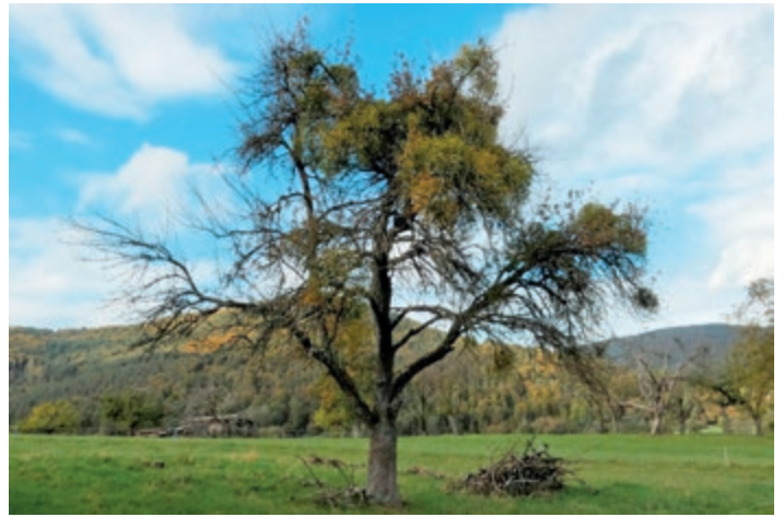
Stark mit Misteln befallene Bäume werden in Fachkreisen auch als „Brokkoli-Bäume“ bezeichnet.