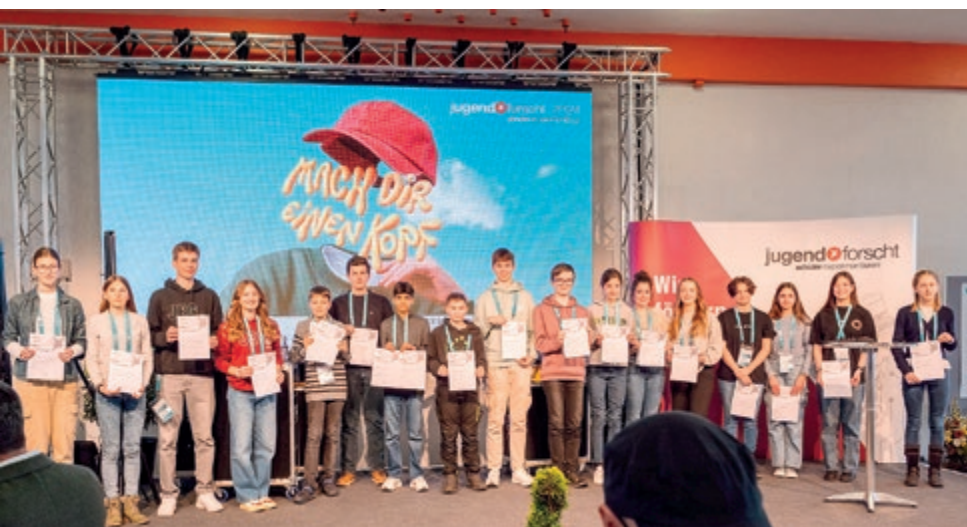
Die Erstplatzierten des Regionalwettbewerbs.