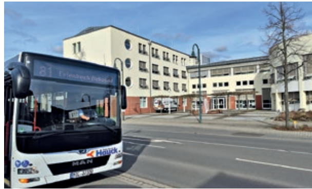
Linienbus vor dem Landratsamt Miltenberg.

Die Idee hinter diesem Jobticket auf Basis des Deutschlandtickets ist es, den Arbeitsweg klimaschonend und preisgünstig mit dem ÖPNV zu bewältigen und es auch in der Freizeit benutzen zu können. Somit übernimmt das Landratsamt eine Vorreiterrolle in Sachen nachhaltiger Mitarbeitermobilität und steigert die Attraktivität des öffentlichen Dienstes.