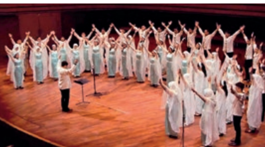
Libels Voice Youth Choir, Indonesien