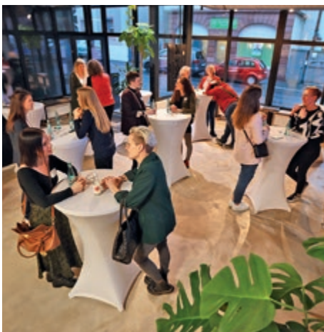
Speed-Dating beim 6. GründerinnenTalk.

6. GründerinnenTalk am Bayerischen Untermain