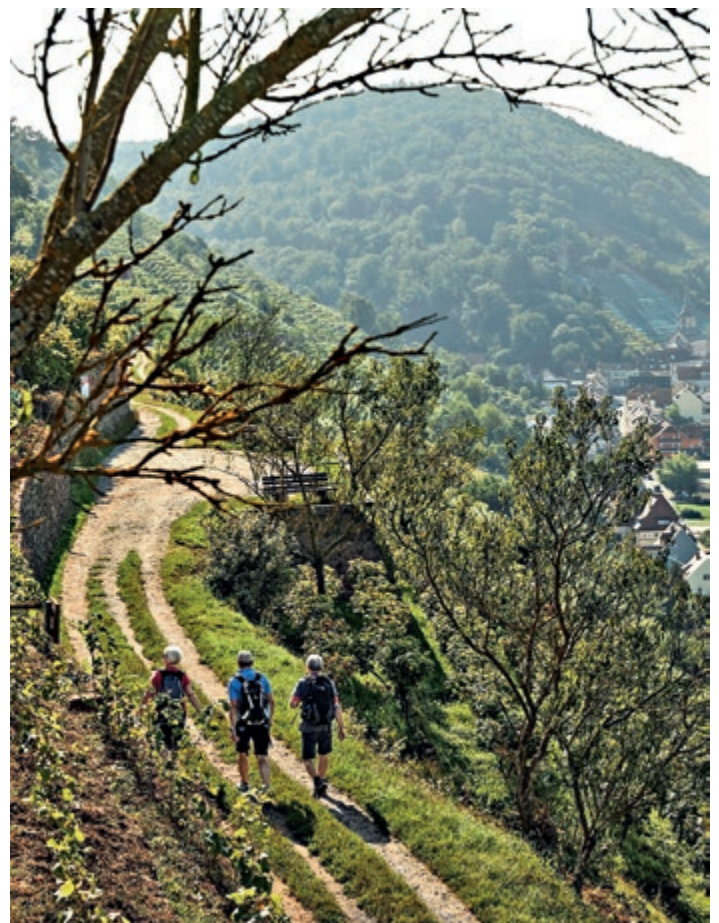
Wandern auf dem Fränkischen Rotwein Wanderweg.

Zum Abschluss sollten sich die Gäste auch einen guten Schoppen in den zahlreichen Gaststätten, Restaurants und Häckerwirtschaften nicht entgehen lassen. Informationen hierzu gibt es im Internet unter www.churfranken.de/genuss-wein/ oder im Weinkalender 2024, den man anfordern kann. du