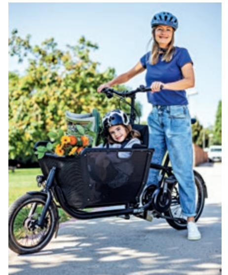
Vom 5. bis 25. Juli heißt es wieder Stadtradeln!