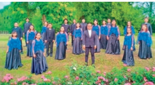
Blue Singers Manado, Indonesien