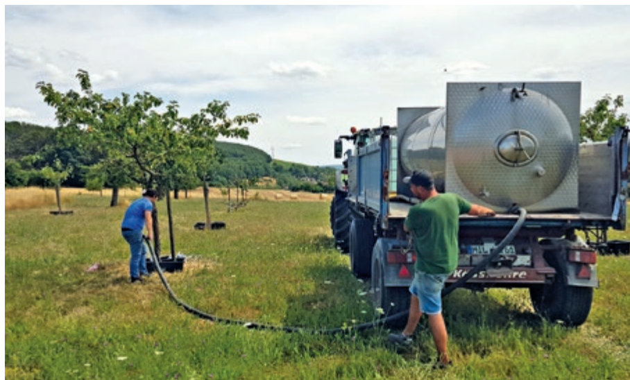
Gerade junge Streuobstbäume sind stark von der Klimaerwärmung und langen Trockenperioden betroffen – gießen ist hier besonders wichtig.

Veranstaltungshinweis: Am 29. Juni findet der Workshop „Richtig Bewässern“ des Naturpark Spessart in Kooperation mit dem Markt Mönchberg statt. Dabei werden Bewässerungstechniken mit Vor- und Nachteilen gezeigt und verglichen – von Bewässerungssäcken bis zum Tankwagen. Weitere Informationen gibt es im Flyer zum „Streuobstjahr 2024“ unter www.naturpark-spessart.de oder www.landkreis-miltenberg.de . sed