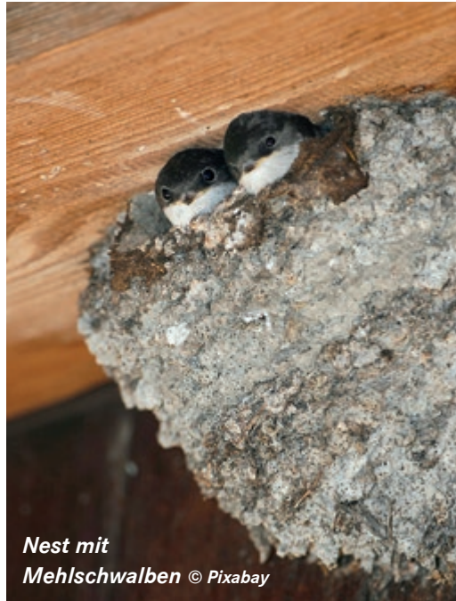
Nest mit Mehlschwalben

Alle heimischen Vogelarten, Fledermäuse und Hornissen sind nach dem Bundesnaturschutzgesetz geschützt. Sie dürfen weder gestört, gefangen, getötet noch ihre Lebensstätten (Nester, Fledermausquartier) zerstört werden.