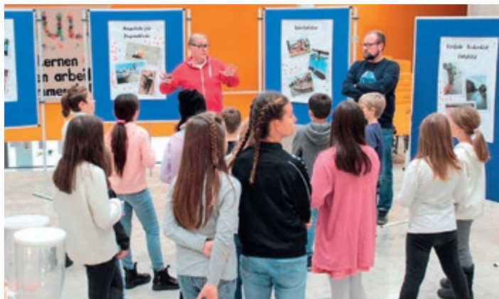
Beim „Projekt Zukunft“ bringen Kinder und Jugendliche ihre Wünsche, Vorstellungen und Erwartungen den politisch Verantwortlichen in den Gemeinden nahe.

Das Projekt bietet eine direkte Form der Beteiligung mit der Chance für die Gemeinde, schnell und konkret Anregungen aufzugreifen und reagieren zu können. Für die Gemeinde bringt das Projekt zusätzlich einen enormen Erfahrungsgewinn über die Lebenswelt und