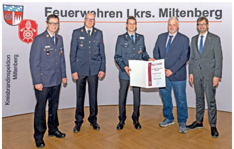
Zu ihrem 150-jährigen Bestehen wurde die Bürgstadter Feuerwehr beim Feuerwehr-Ehrenabend des Landkreises Miltenberg mit einer Urkunde ausgezeichnet. Im Bild (von links) Kreisbrandrat Martin Spilger, Kreisbrandinspektor Hauke Muders, der Bürgstadter Kommandant Franz Weigl, Bürgstadts Bürgermeister Thomas Grün und Landrat Jens Marco Scherf.