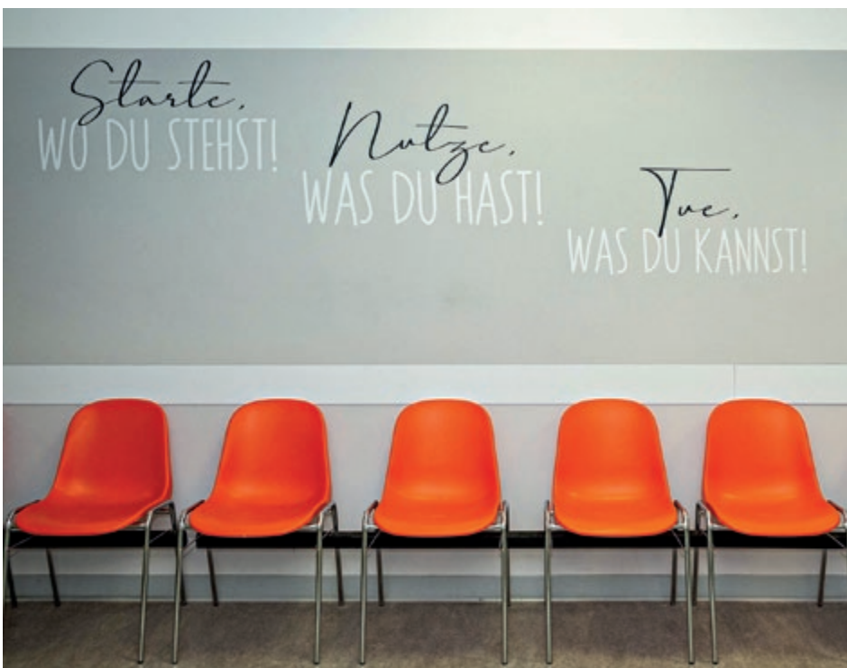
Angenehme Atmosphäre im Wartebereich des Miltenberger Jobcenters.