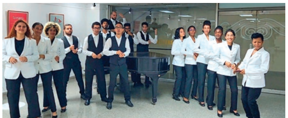
Havana's University Choir, Kuba

In diesem Jahr nehmen gleich zwei Chöre aus Indonesien am Wettbewerb teil. Die Blue Singers Manado kommen, wie es der Name schon sagt, aus Manado.