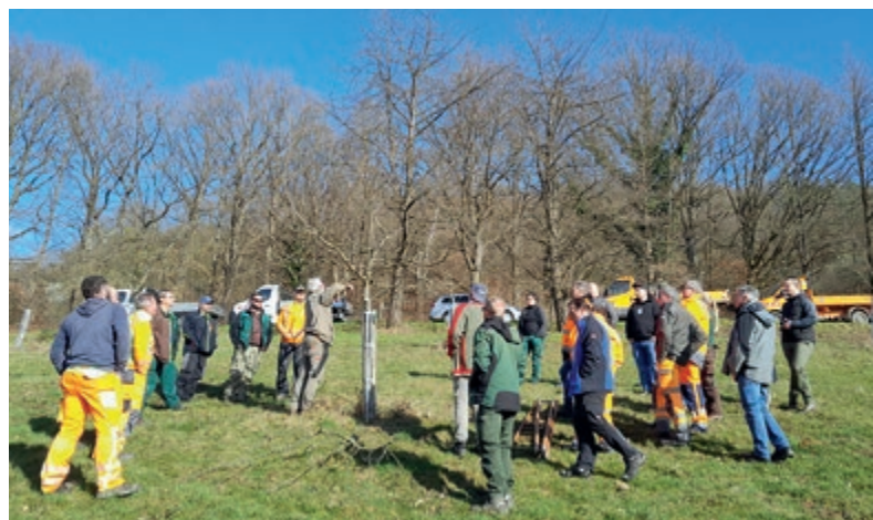
Kursteilnehmende bei der Vertiefung der theoretischen Kenntnisse in der Praxis.

Am Nachmittag setzten die Teilnehmenden dann das Gelernte unter fachlicher Anleitung in die Tat um.