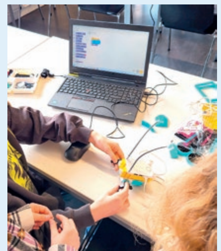
Mädchenpower beim Coden: LEGO-Grashüpfer mit Open Roberta programmieren.