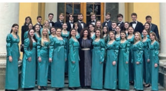
College of Arts Students' Choir, Belarus