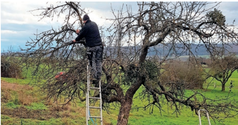
Ein regelmäßiger, fachgerechter Schnitt ist die effektivste Bekämpfungsmaßnahme.