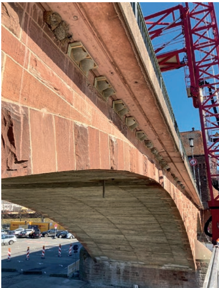
Mehlschwalben-Kunstnester als Ausgleich für entfernte Nester. Hier: Mainbrücke Miltenberg.