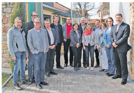
Der Ausschuss besteht aus je einem Fraktionsvertreter, Vertreter der freien Träger sowie der Jugendamtsleitung, Jugendhilfeplanung, Sozialplanung und dem Bereich Jugendarbeit und Jugendsozialarbeit an Schulen. Das Bild zeigt die Teilnehmer der Klausurtagung und Mitglieder des Ausschusses.

wird dieses Jahr die Planungsschritte in drei weiteren Sitzungen quartalsweise begleiten, bevor am 27. Januar 2018 die Ziele überprüft werden und die weitere Planung in der nächsten jährlichen Klausurtagung erfolgen wird. rä