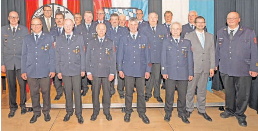
Seit vier Jahrzehnten sind diese Feuerwehrmänner im Einsatz.