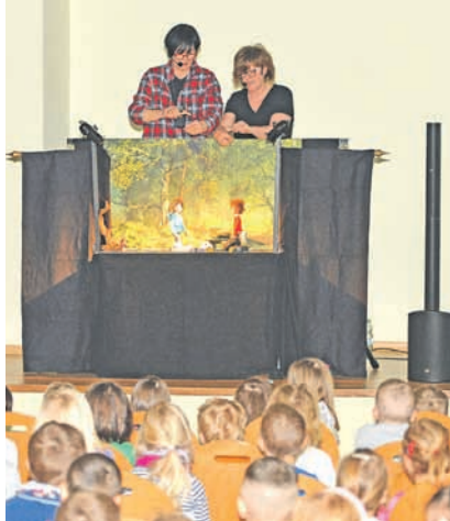
Vor zahlreichen Kindergartenkindern feierte das Puppentheaterstück "Johnny und das Müllmonster" in Bürgstadt Premiere.