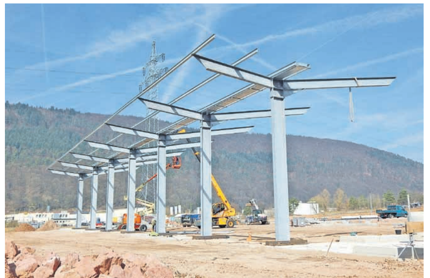
Fundamente und Entwässerungsrinnen sind gelegt, es geht weiter voran. Bis Ende April werden die L-Steine zur Begrenzung der Auffahrtsrampe zu sehen sein. Anschließend wird die Rampe aufgeschüttet.