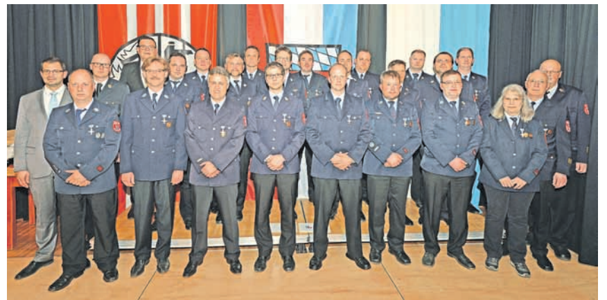
Das Staatliche Feuerwehrereichen für 25-jährige aktive Dienstzeit erhielten diese Feuerwehrleute.