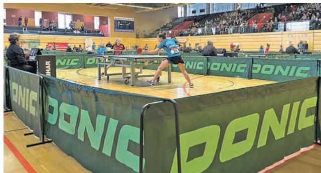
Hochbetrieb in den zwölf Boxen beim Tischtennis-Bundesranglistenfinale in Elsenfeld.