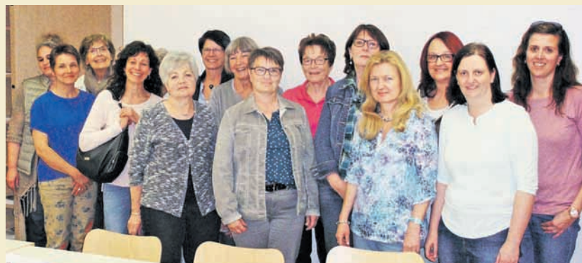
Die 16 erfolgreichen Teilnehmerinnen.

Beratung von Betroffenen und Angehörigen, Begleitung von ehrenamtlichen Helfern, Öffentlichkeits- und Netzwerkarbeit. Etablierte Projekte wie etwa Gottesdienst für Menschen mit Demenz und Fortbildungsangebote werden fortgesetzt. sch