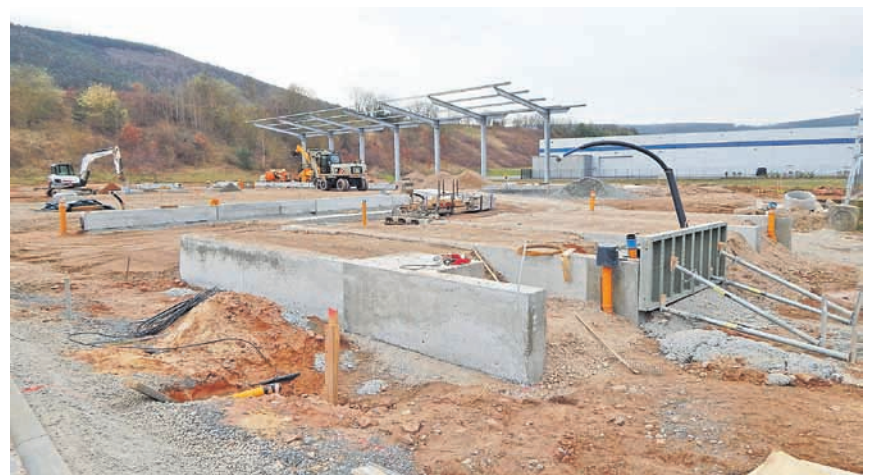
Die Bürgerinnen und Bürger können sich freuen: Im August wird ihnen der neue Wertstoffhof zur Verfügung stehen.