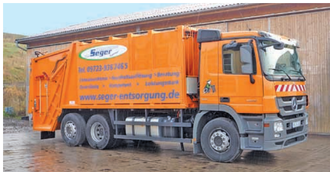
Vom 1. Juli an übernimmt die Firma Seger die Müllabfuhr.

Verabschieden müssen wir uns von der Firma Remondis, die seit dem 1. Januar 2009 unsere Abfälle eingesammelt, der Entsorgung zugeführt und dabei gut und erfolgreich für den Landkreis gearbeitet hat.