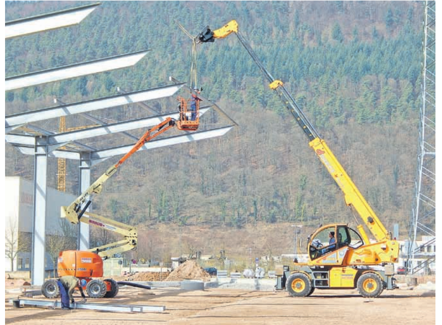
Anfang März haben die Stahlbauer das Stahlgerüst für die Überdachung der Containeranlage montiert.

Mit dem neuen Wertstoffhof erfüllt sich der Wunsch vieler Bürgerinnen und Bürger aus dem Süden des Landkreises. Die Errichtung soll zum einen für eine möglichst hohe Quote der sinnvollen Verwertung von Wertstoffen sorgen und zum anderen einen möglichst guten Service für die Bürgerinnen und Bürger bieten. rö