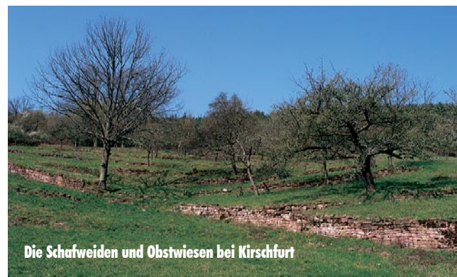
Die Schafweiden und Obstwiesen bei Kirschfurt

Die Maßnahmen kommen zahlreichen gefährdeten Tier- und Pflanzenarten zu Gute. Aufgrund der besonderen geologischen Situation finden sich hier Sandmagerrasen eng verzahnt mit