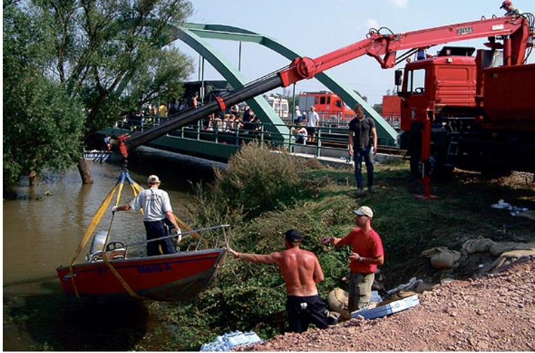
Ein Boot wird mit dem (Auto)kran der FFW Großheubach zu Wasser gelassen