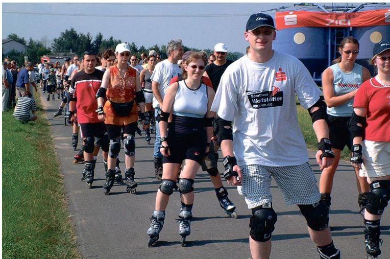
Begeisterte Skater genossen die freie Fahrt auf der gesperrten Straße

Ein großartiger Erfolg war die 2. Inliner Tour des Landkreises Miltenberg. 400 Skater nutzten die Gelegenheit, mit rasanten Rollen den zwölf Kilometer langen Rundkurs zwischen Großwallstadt und Niedernberg beliebig oft zu befahren. Bei brütender Hitze blieb es den Teilnehmern und vor allem deren Tagesform überlassen, in welcher Zeit sie dies bewältigten. Jedenfalls kamen sie alle schon nach wenigen hundert Metern Fahrt ins Schwitzen. Damit es für die Teilnehmer ein unbeschwerter Nachmittag wurde, erhielten alle ein Freigetränk sowie ein T-Shirt, gesponsort von