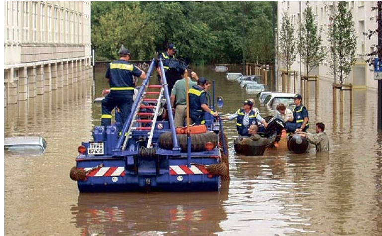
Die Fachgruppe Wassergefahren bei Evakuierungen in Dresden

Das THW OV Miltenberg war mit der Fachgruppe Wassergefahren im Einsatz. Die Tätigkeiten der 20 Helfer umfasste den Bau von Sandsackwällen, die Versorgung von Flutopfern und Einsatzkräften sowie das Auspumpen von Gebäuden. Einsatzorte waren u.a. Dresden, Pirna, Grimma u. Weesenstein. Erste 9 Helfer vom OV Miltenberg wurden am 16.8.2002 in Dresden eingesetzt. An der Semper-Oper u. am Zwinger wurden Sandsackwälle errichtet. Mit der Fachgruppe Wasserscha-den/Pumpen (Lohr) wurde das