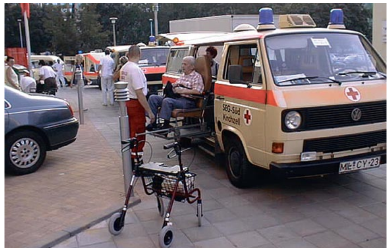
Die BRK-Helfer bei der Evakuierung von Bewohnern eines Altenheimes