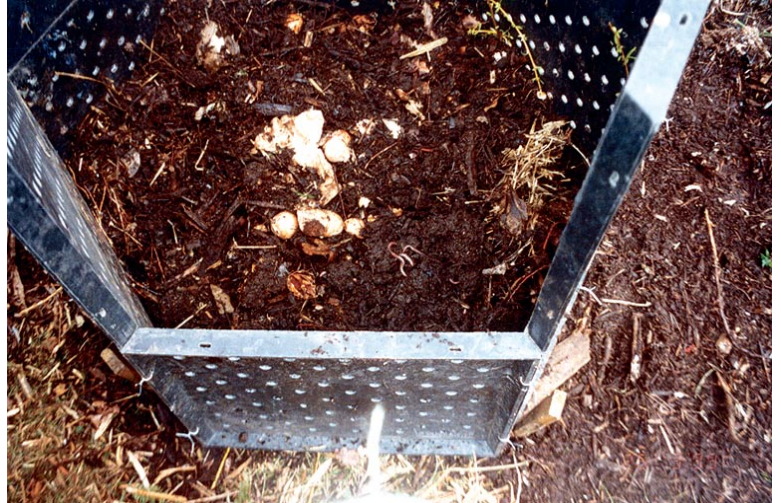
Grober Kompost (aus dem eigenen Komposthaufen) für die Herbstausbringung

Pflanzung oder Aussaat und während der Wachstumszeit in Frage. Weitere Informationen zu Aufwandmengen, Komposteinsatz in der Landwirtschaft, Öffnungszeiten der Kompostieranlagen usw.