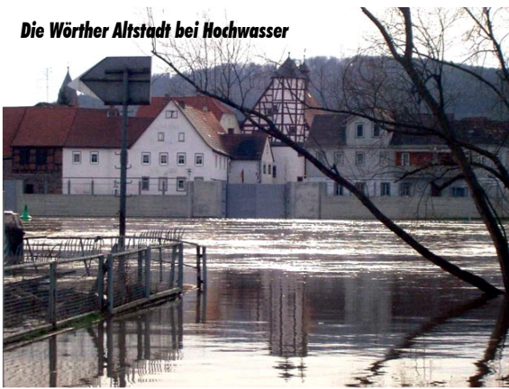
Die Würther Altstadt bei Hochwasser

Festgesetzt mit Verordnung ist das Überschwemmungsgebiet des Maines, der Erf im Bereich des Marktes Bürgstadt, der Elsave im Bereich des Marktes Elsenfeld und des Wildbaches in Riedern.