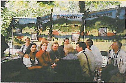
Am Frankfurter Museumsuferfest, 25. - 27. August 2000, wirkten der Verein Regionalmarketing Miltenberg e.V. und der Arbeitskreis "10 Jahre Fränkischer Rotweinwanderweg" mit einigen Winzern, Gastronomen und Tourist-Informationen mit.

Die Gastronomie lädt zur Aktion "Küche & Wein" ein