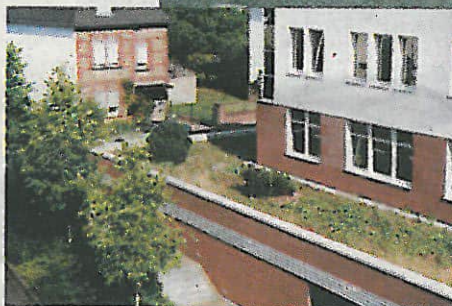
Photovoltaikanlage Realschule Oberburg und Dachbegrünung Landratsamt

Landrat oder aber auch an Gemeinden oder sonstige Interessenten weiter