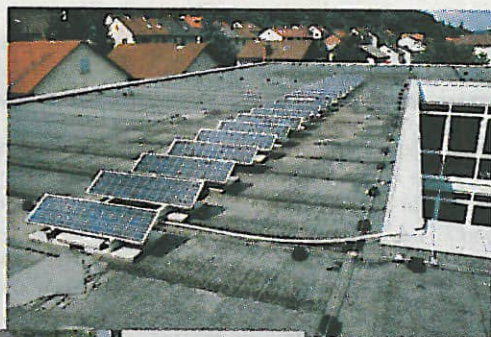
Zwei Beispiele für gelungene Agenda-Projekte: